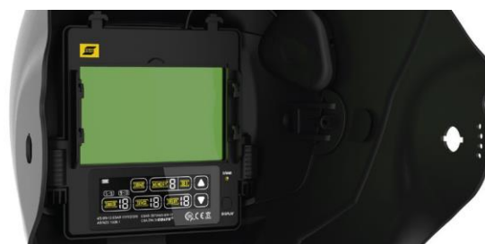
Alta classe óptica do filtro ADF, e interface colorida touch-screen.