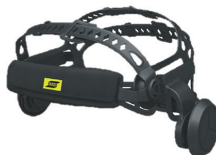
Carneira Halo com 5 pontos de ajuste (visão frontal)