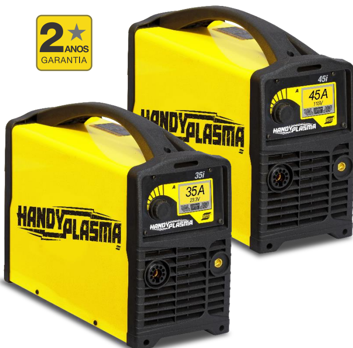
HandyPlasma 35i / 45i

Fonte para corte plasma manual, leve e portátil, com alimentação monofásica 220V 50/60Hz.